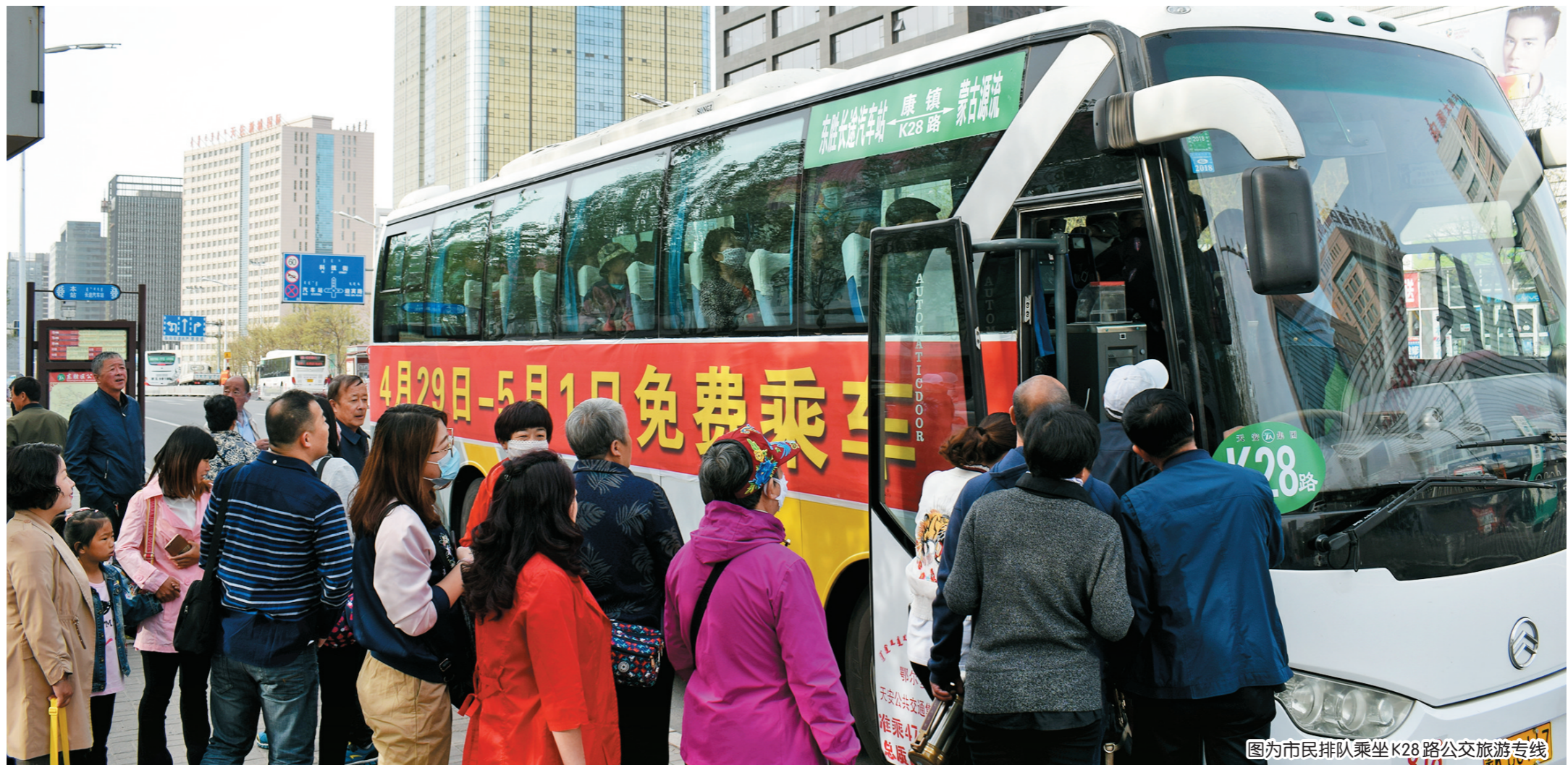
图为市民排队乘坐K28路公交旅游专线